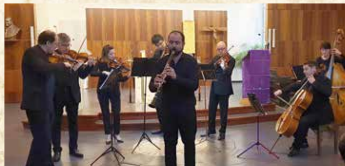
Concert du 7 mars 2020

Transilien : gare Saint-Lazare direction Maisons-Laffitte ou Poissy, arrêt : Sartrouville puis bus : ligne 9 ou bus 272 arrêt Condorcet.